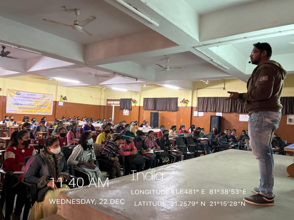
India 11:40 AM WEDNESDAY, 22 DEC LONGITUDE 81.6481° E 81°38'53"E LATITUDE 21.2579° N 21°15'28"N