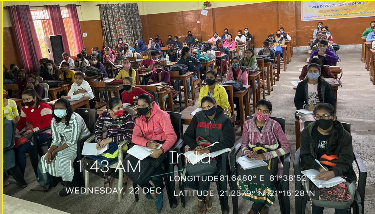
India 11:43 AM WEDNESDAY, 22 DEC LONGITUDE 81.6480° E 81°38'52"E LATITUDE 21.2579° N 21°15'28"N